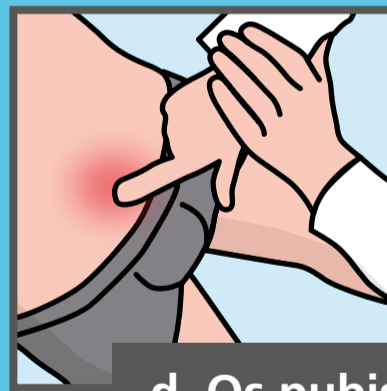
d. Os pubis-gerelateerd

Waarschijnlijker indien: - Pijn bij heupflexie tegen weerstand - Pijn bij rektest heupflexoren